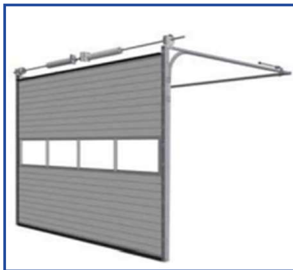
● Standard Lift