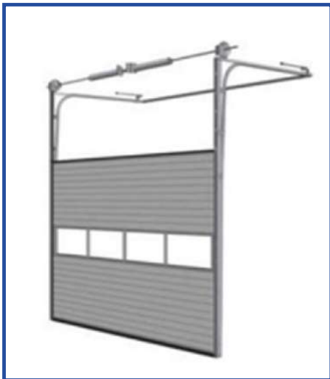
● High Lift